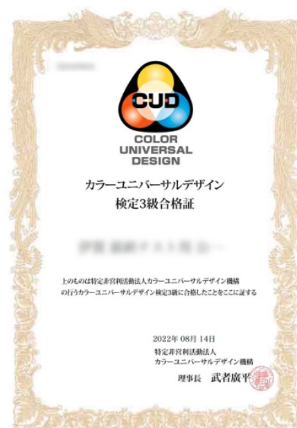
カラーユニバーサルデザイン検定 3級デジタル合格証 (サンプル)