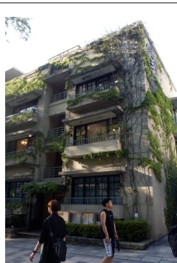
ギャラリー同潤会外観

dojunkai.com/%E5%B1%95%E8%A6%A7%E4%BC%9A%E4%BA%88%E5%AE%9A-1/